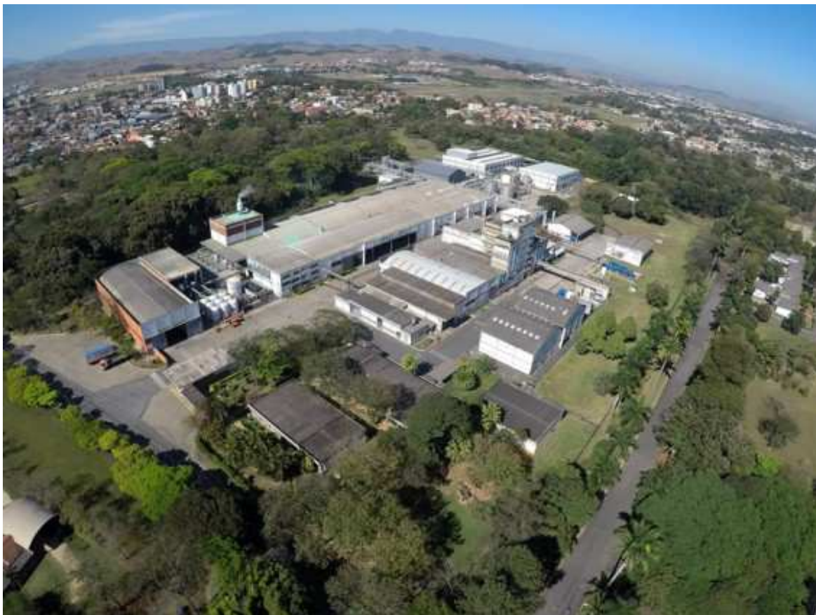
Unidade industrial da Albaugh na cidade de Resende RJ: foco na expansão do mercado de defensivos genéricos.

São Paulo – Fundada nos Estados Unidos, em 1979, pelo empresário Dennis Albaugh, e atuante no Brasil há pouco mais de um ano, após a aquisição das empresas Atanor e Consagro, a Albaugh aposta no avanço dos defensivos agrícolas genéricos na agricultura brasileira. Com a execução de uma estratégia ousada nos próximos anos, e a meta de figurar entre as dez maiores empresas do setor de agroquímicos, a companhia americana apoia a realização do 2º Congresso Nacional das Mulheres do Agronegócio.